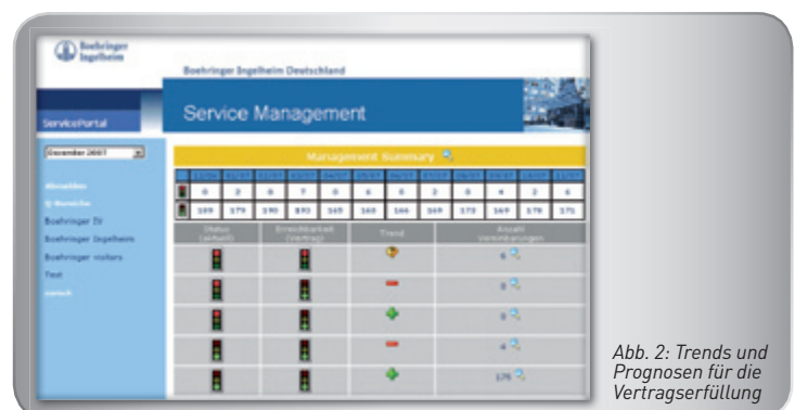
Abb. 2: Trends und Prognosen für die Vertragserfüllung